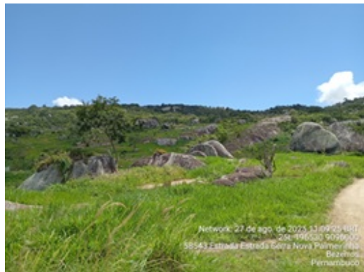
Figura 6: Exemplo do tipo de solo litólico na parte final do traçado no topo da Serra Negra.