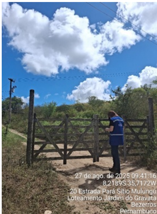
Figura 15: Porteira de propriedade privada