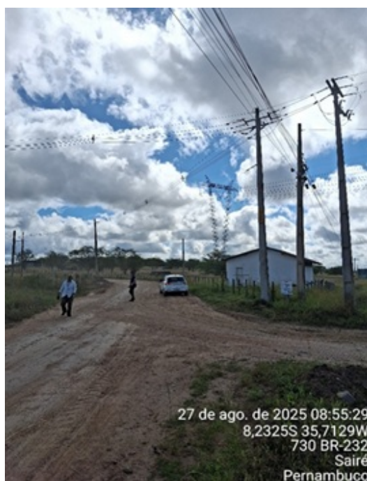
Figura 8: Postes de alta e baixa tensão