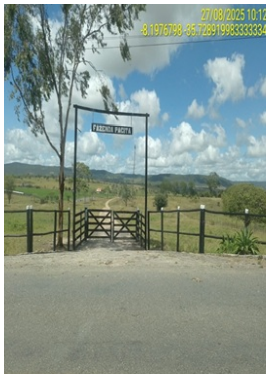
Figura 16: Porteira de propriedade privada