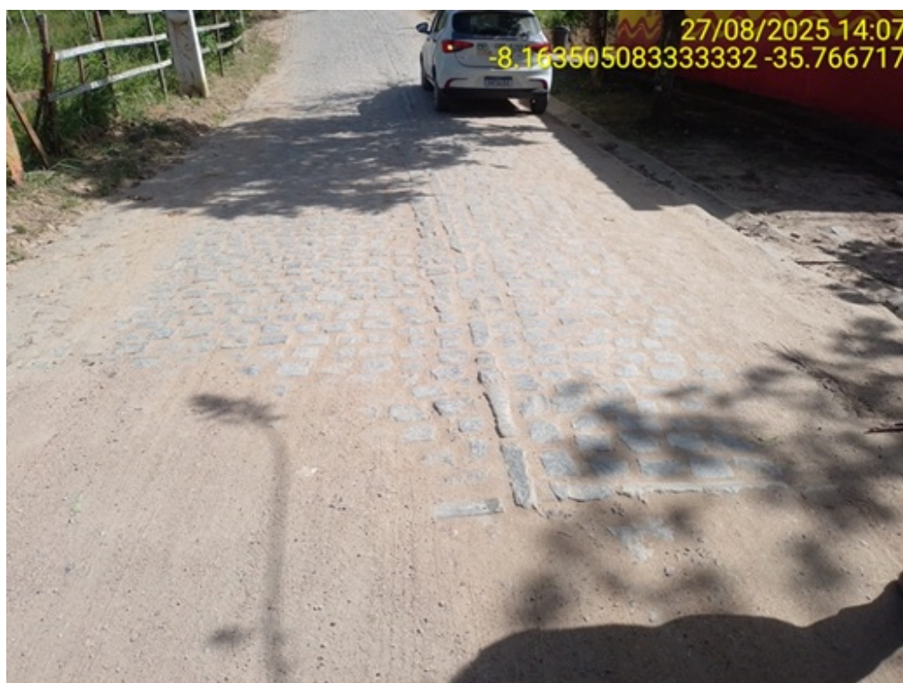
Figura 23: : Final do trecho, encontro com o trecho pavimentado em paralelepípedo..