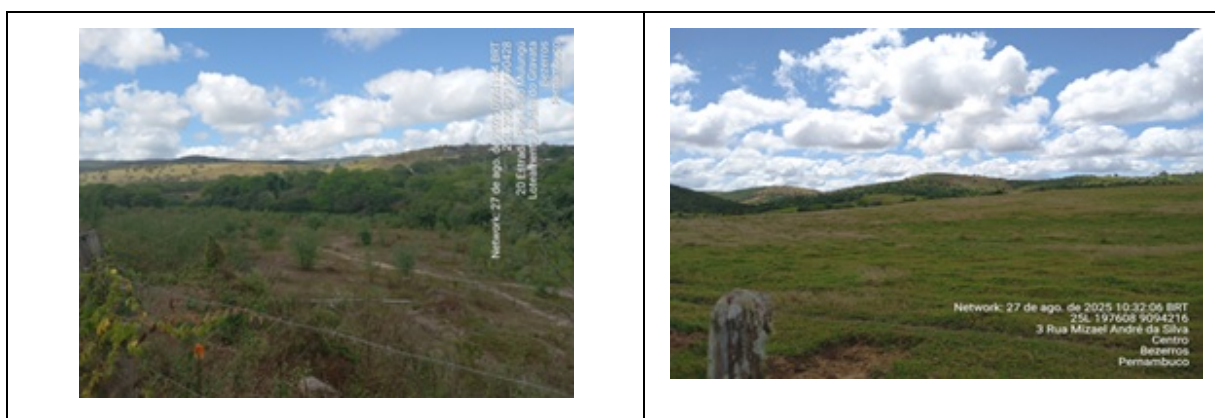
Figura 2: Aspecto geral dos arredores da rodovia projetado VPE-098 o município de Bezerros

O trecho apresentado, com 12,50 km de extensão, foi inspecionado em agosto de 2025, gerando o relatório fotográfico a seguir: