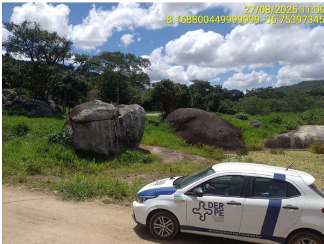
Figura 19: Afloramento rochoso.