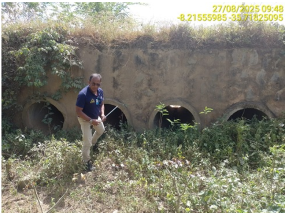
Figura 17: Bueiro quádruplo tubular de concreto com d=1,0\text{m}