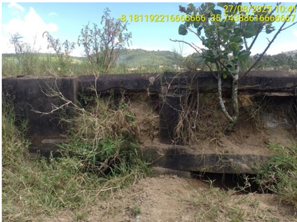
Figura 18: Bueiro triplo celular de concreto