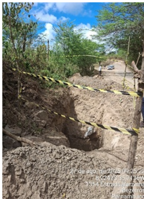
Figura 9: Rede de abastecimento de água