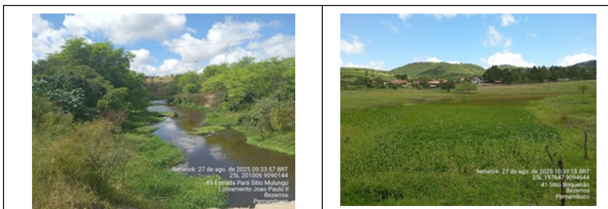
Figura 3: Ponte sobre rio Ipojuca que deverá ser substituída