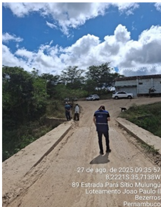
Figura 13: : Ponte sobre o rio Ipojuca