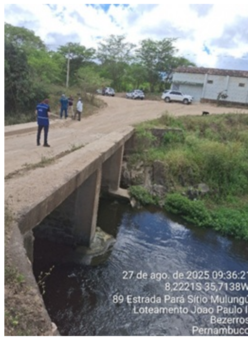
Figura 14: Ponte sobre o rio Ipojuca