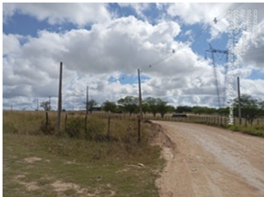
Figura 5: Exemplo do tipo de solo planossolo no início do traçado no entrocamento com a BR-232, base da Serra Negra