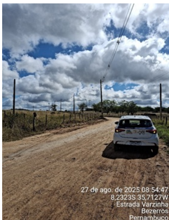
Figura 7: Início do Segmento - Interseção