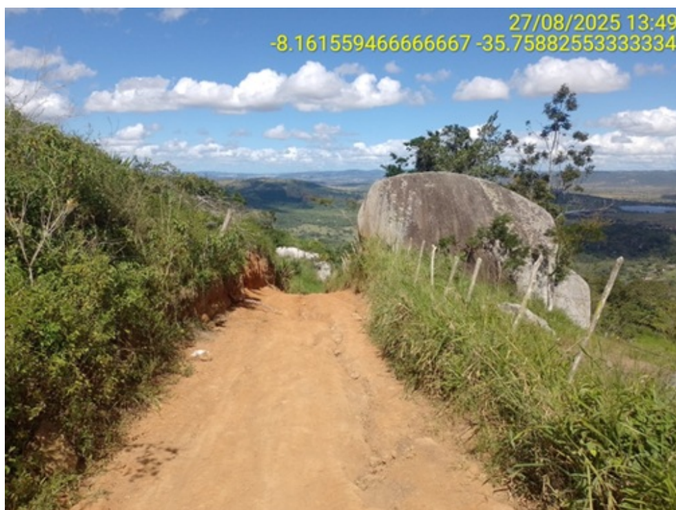
Figura 20: Afloramento rochoso.